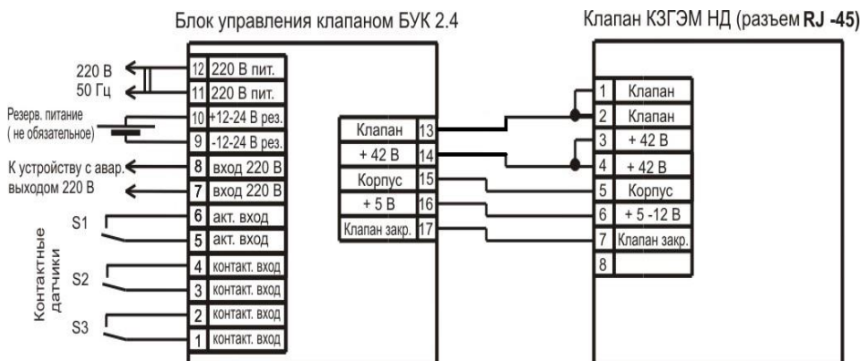
Рис 1. Схема подключения клапана КЗГЭМ (НД) с разъемом RJ-45