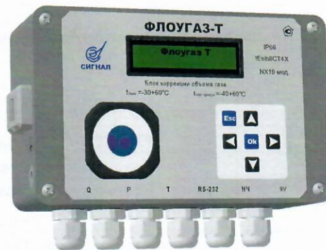
Рисунок 1 - Общий вид блока коррекции объема газа «Флоугаз-Т»

Для передачи информации о стандартном (или рабочем) объеме газа предусмотрен НЧ-выход.